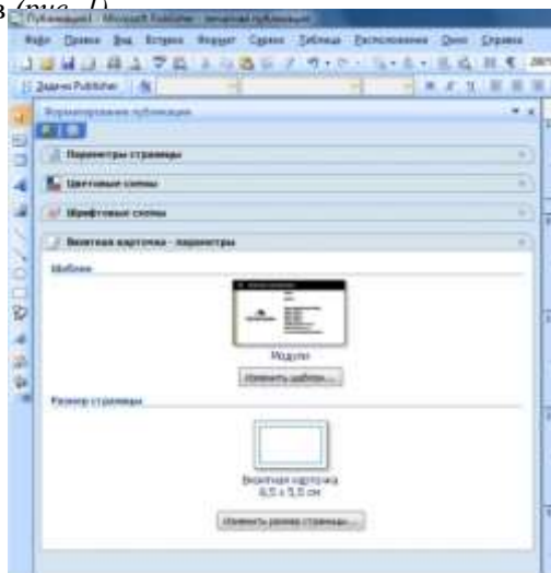
Рис. 1. Окно «Форматирование публикации»

Создать визитную карточку с помощью собственного шаблона либо с помощью шаблонов Publisher. Чтобы выбрать цвета и шрифты, соответствующие имиджу, можно использовать Цветовые схемы и Схемы шрифтов (рис. 1).