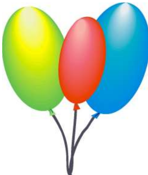
Рис. 4. Применение заливки к фигуре